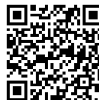
『P地獄少女四』 アプリ紹介サイトQRコード

©JFJ CO., LTD. ALL RIGHTS RESERVED. ©SUNSOFT