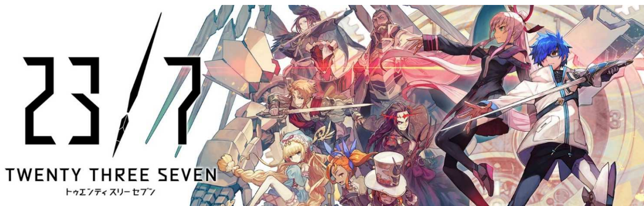
© 2018 FUJISHOJI CO., LTD. ALL RIGHTS RESERVED.

当社はこのたび、2018年8月10日(金)、11日(土)、12日(日)に東京国際展示場(東京ビッグサイト)で開催される コミックマーケット94 におきまして、完全オリジナルのスマートフォン向けRPG『23/7 トウエンティ スリー セブン』(以下『23/7』)が初出展することをお知らせいたします。