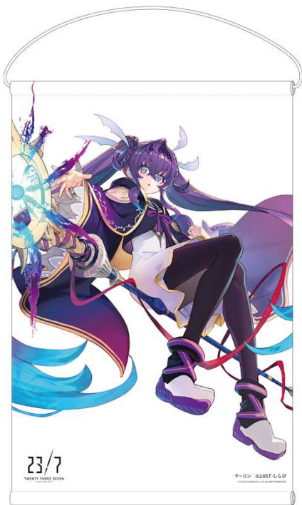
キャラクタータペストリー

※オリジナルグッズの限定セットは、キャラクターが異なる「白ver.」と「黒ver.」の全2種類をご用意しております！