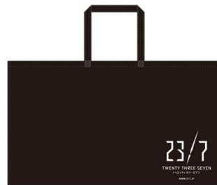
ショッパーバッグ