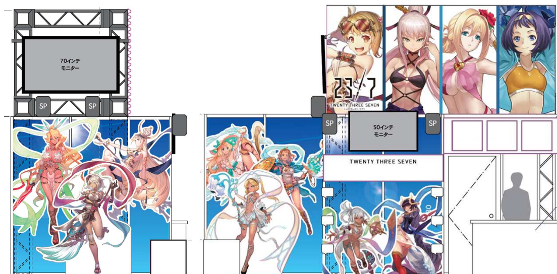
※ブースデザインはイメージです

そして、『23/7』のブースでは、夏らしく水着キャラクターを全面に押し出した爽やかなデザインブースにて、来場者の皆様をお待ちしております。 コミックマーケット94 にご来場の際には『23/7』ブースに、ぜひお立ち寄りください！