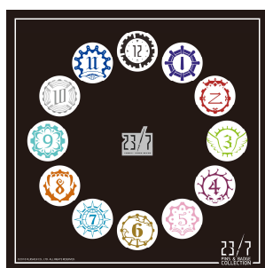
クロッカーズ缶バッジセット